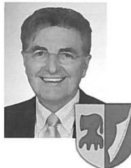
Ihr Hans Peis, 1. Bürgermeister