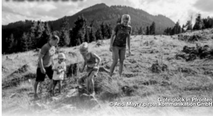
Gipfelglück in Pfronten