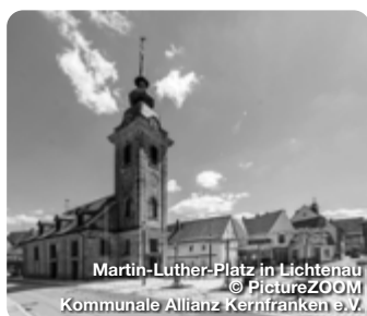
Martin-Luther-Platz in Lichtenau

In Kernfranken ist der Genuss zu Hause. Die Region im Herzen Mittelfrankens ist nicht nur reich an kulturellen Sehenswürdigkeiten und abwechslungsreichen Freizeitangeboten. Hier erleben Sie echte Gastlichkeit und typisch fränkische Küche, die zu jeder Jahreszeit ganz besondere Schmankerl zu bieten hat. Von knusprigem Karpfen über deftige Brotzeiten bis hin zu köstlichen Spargelgerichten reichen die fränkischen Gaumenfreuden. Dazu passt immer ein gut gekühltes Bier. Besuchen Sie die Städte und Gemeinden Kernfrankens und lassen Sie sich von ihrer kulinarischen Vielfalt verwöhnen! Übrigens: Für einen längeren Aufenthalt bieten Hotels, Gaststätten und Ferienwohnungen immer komfortable Unterkünfte. TreffpunktDeutschland.de/kernfranken