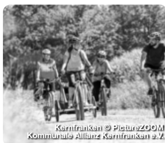
Kernfranken © PictureZOOM Kommunale Allianz Kernfranken e.V.