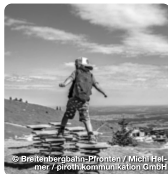
Breitenbergbahn-Pfronten / Michi Helmer / piroth.kommunikation GmbH

An der Talstation der Breitenbergbahn scheint es für Kinder Augen schwer vorstellbar, dass die Vierergondel Menschen auf 1.540 Meter Höhe befördert. Einmal drin, ist es dann umso schwieriger wieder aus dem Staunen rauszukommen. So schweben Naturfreunde über die grünen Bergwiesen hinweg, vorbei an grasenden Kühen und immer höher hinauf mit einem eindrucksvollen Weitblick auf Pfronten und das Voralpenland. Oben angekommen sorgt das weitläufige Almagebiet der Hochalpe mit dem mystischen Aggenstein und dem Breitenberg für weiteres Staunen. Nur wenige Meter oberhalb der Bergstation erwartet Mutige ein Aussichtsteg, der mehrere Meter über den Felsrand ragt. Wer sich bis nach vorne zur Glasfront traut, wird mit einer imposanten Weitsicht über Pfronten belohnt. Beim Blick in die Ferne lässt sich unter anderem die Burgruine Falkenstein sichten, die auf 1.277m die höchstgelegene Burgruine Deutschlands ist.