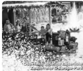
Österreich Josefina kaiserliche Zauberreise