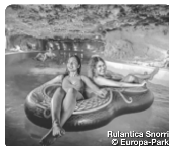
Rulantica Snorri