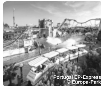
Portugal EP-Express

Auch Fans von Virtual Reality werden sich im Europa-Park Erlebnis Resort prächtig amüsieren: In der neuen YULLBE PRO Experience „Amber Blake: Operation Dragonfly“, erleben die Gäste einen interaktiven 3D-Action-Thriller. Für noch mehr Urlaubsfeeling sorgt ein Besuch in der Wasserwelt Rulantica. Im neuen Bereich „Nordiskturn“ ist Rutschenspaß mit Wettkampf Charakter garantiert: Highlight des 30 Meter hohen Turms ist die auf einer funkelnden Edelsteinmine errichtete Rennrutsche „Vikingløp“. Europa-Park, Rust