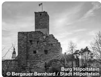
Burg Hilpoltstein